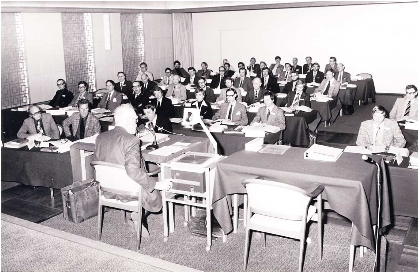
Joseph Juran, som alltid sittande vid overheadapparaten, under ett kurstillfälle i Göteborg 1975.

den till detta arbetssätt lade förresten Juran i början på 1980-talet när han hjälpte Motorola med ett omfattande förbättringsprogram som blev mycket framgångsrikt.